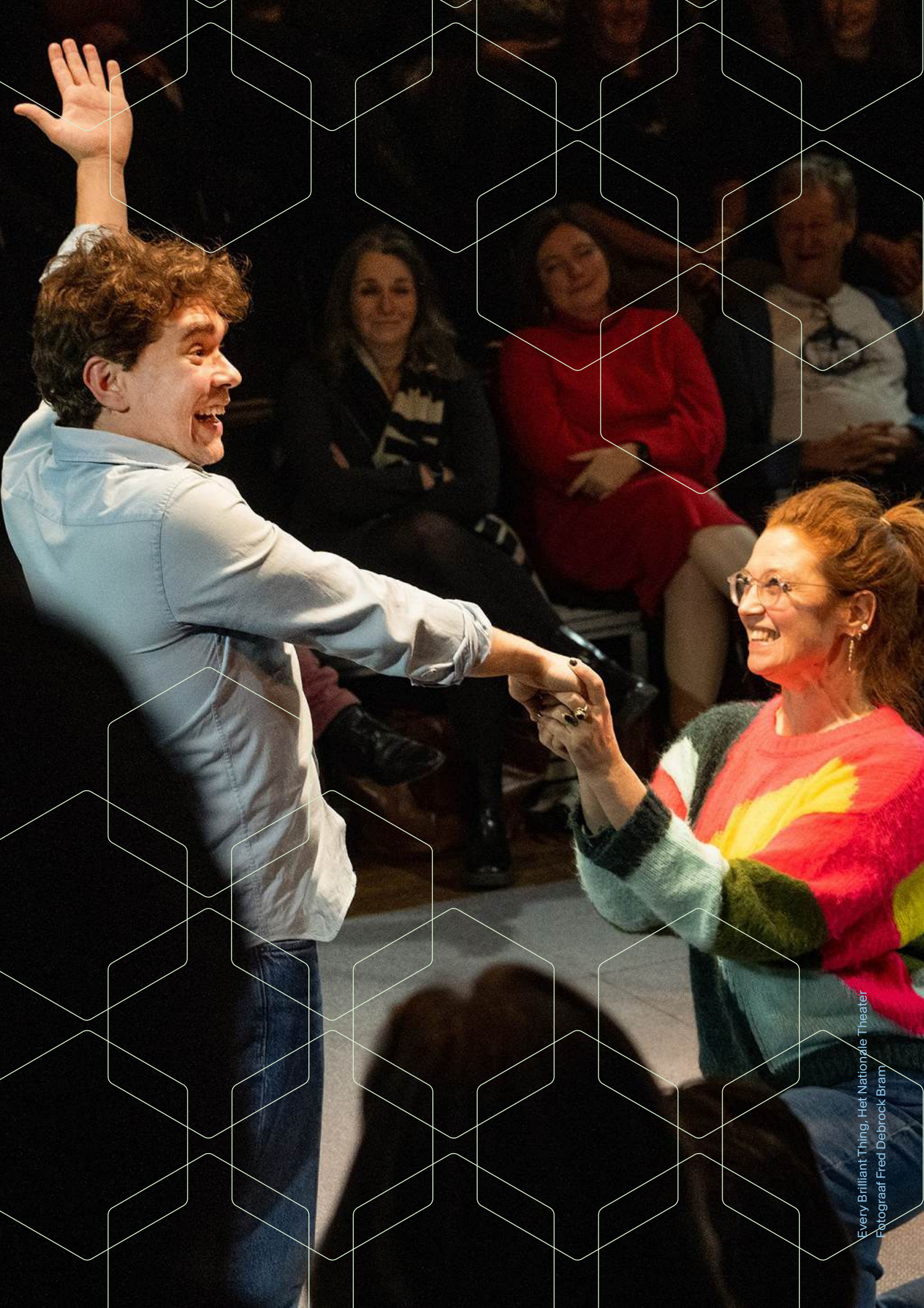
Every Brilliant Thing, Het Nationale Theater Bram