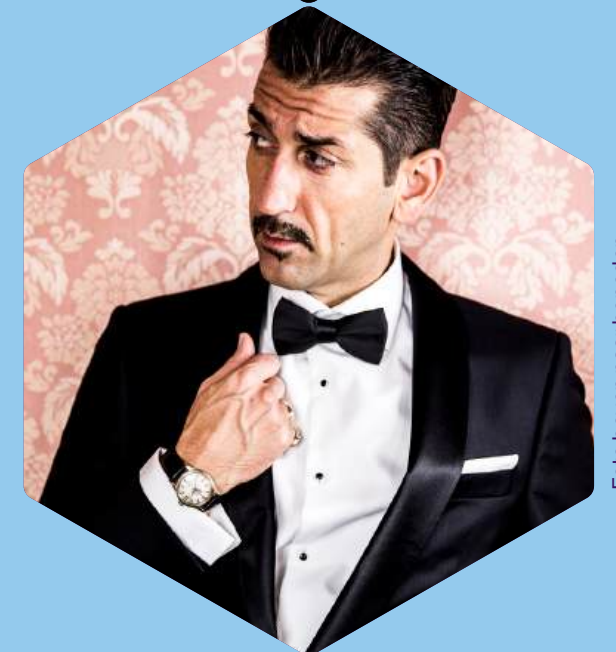
Foto boven naar beneden Miss Montreal, Noorderlijk Film Festival, Danny Vera