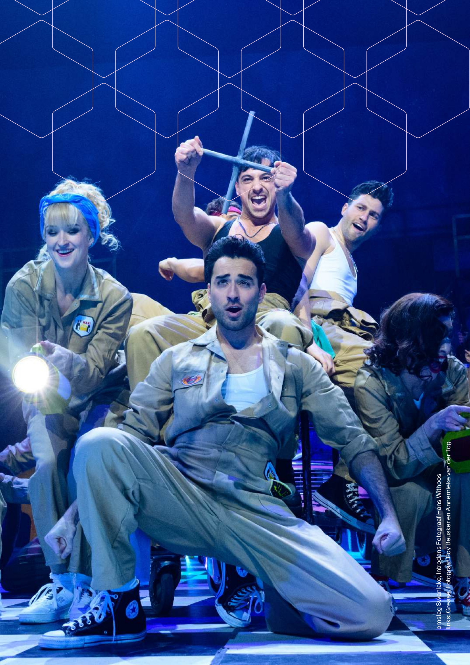
omslag Swaniak, Introdans Fotograaf Hans Withoos links: Grease, Fotograaf Roy Beusker en Annemieke van der Tog