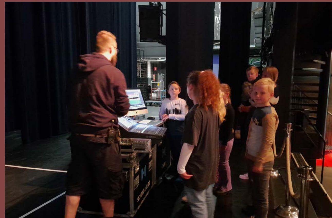
Onder de titel 'techniekmenu' organiseert de afdeling educatie i.s.m. de afdeling techniek speciale techniekdagen waarop leerlingen met het vak theatertechniek in aanraking komen.