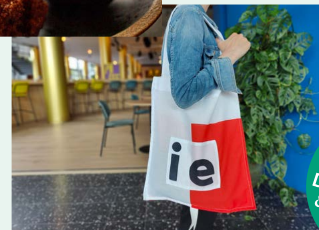
Tassen voor publiek gemaakt van oude vlaggen van De Harmonie.