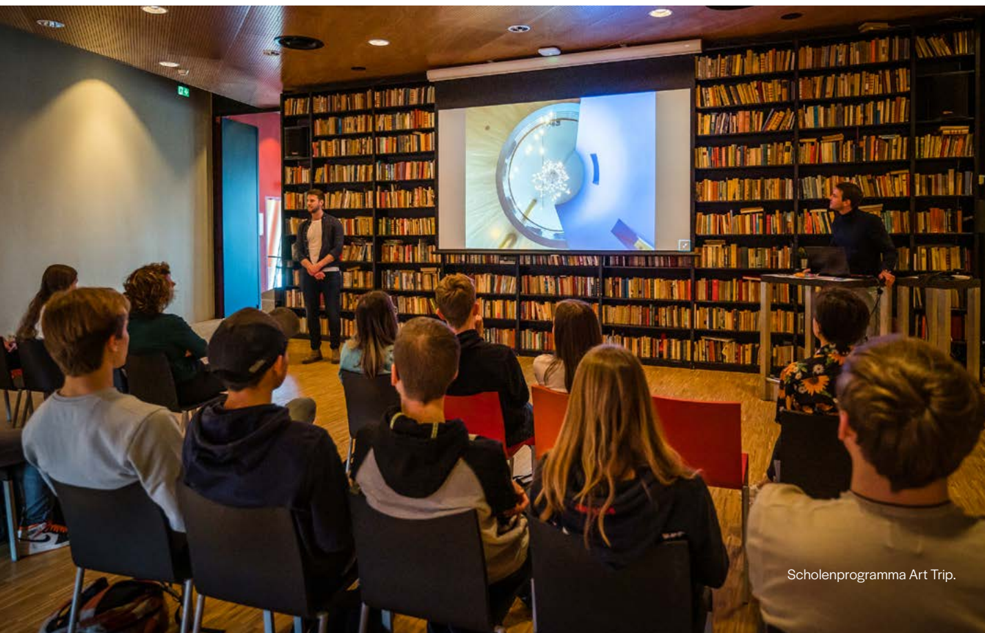
Scholenprogramma Art Trip.

In 2022 ontvingen we in De Harmonie 4000 leerlingen van het onderwijs voor ons educatieprogramma, en 55 studenten van de opleiding Docent Theater.