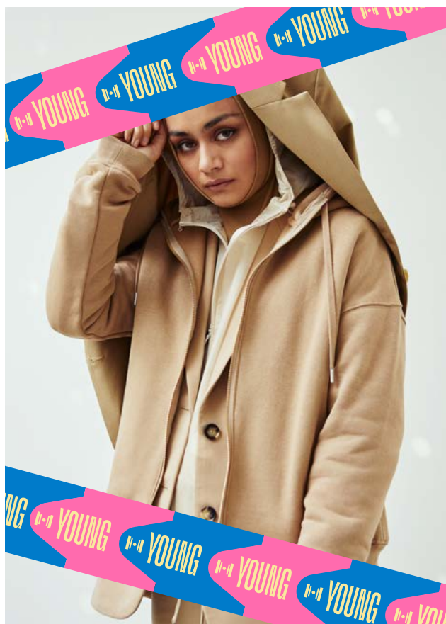
Campagne voor YOUNG. Beeld van Toneelgroep Oostpool - Laura H.