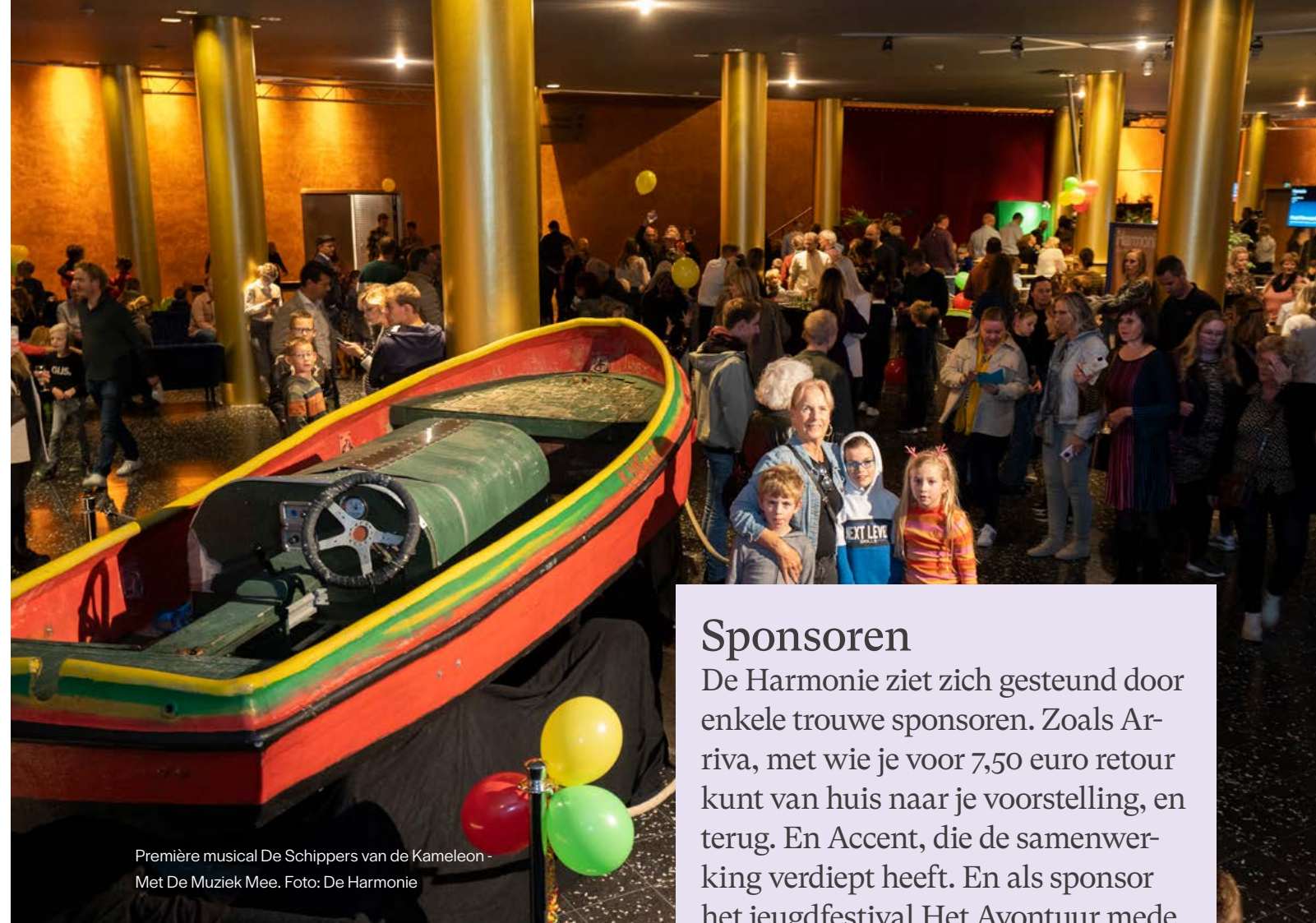
Première musical De Schippers van de Kameleon - Met De Muziek Mee.

In 2022 is de aanzet gedaan om meer data-gedreven te werken, juist ook vanuit de marketing. Daarom zijn we gaan samenwerken met Ticketworks. Hieruit kunnen wij niet alleen gericht, persoonlijker en geautomatiseerd mailen, maar door de implementatie van dit systeem hebben wij ook betere inzichten gekregen in onze ticketkopers. Met deze data kunnen wij veel betere analyses maken en