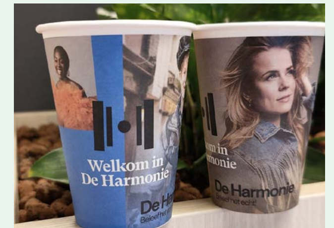
De gebruikte koffiebekertjes in De Harmonie gaan in speciale prullenbakken, zodat zij kunnen worden omgezet naar papieren handdoekjes voor bij de toiletten.

Theatercafé Kwint is een mooi voorbeeld van onze duurzame ambities. De bar is hergebruikt en het hout van de meest duurzame kwaliteit. Daarnaast hebben we meer circulaire producten opgeleverd. De oude vlaggen zijn hergebruikt tot mooie tassen en onze koffiebekers worden verwerkt tot papieren handdoekjes. Ook de bedankjes voor de artiesten zijn omgeturnd van (niet duurzame) bloemen naar pakketjes met lokale producten, we ontvingen er positieve reacties op. Dat gold ook voor de Warme Truien-dag en de 'Loop naar je Werk'-dag. Allemaal stappen die met elkaar veel bewustzijn impact realiseren. Het allergrootste compliment in 2022 is het behouden van het Green Key Gold-certificaat. Een onderscheiding die je iedere keer weer opnieuw moet verdienen met blijvende aandacht en nieuwe stappen op de groene ladder.