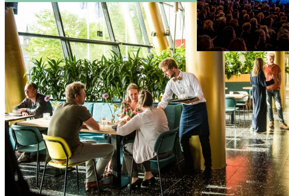
< Theatercafé Kwint maakt je avondje uit compleet.