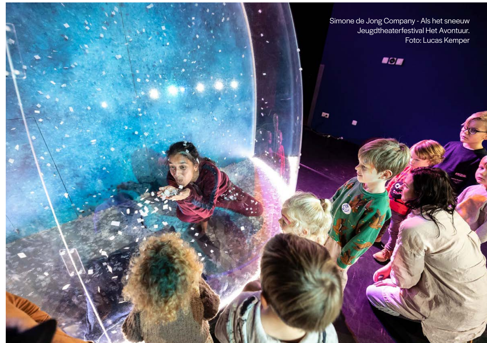
Simone de Jong Company - Als het sneeuw Jeugdtheaterfestival Het Avontuur.