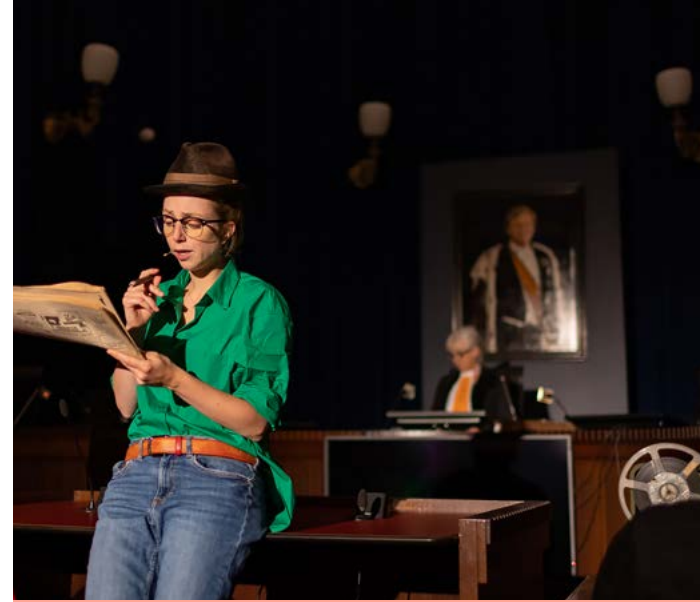
< Kneppelfreed, locatietheater in het Paleis van Justitie Co-productie Pier21 en De Harmonie.

We zijn blij met deze programmatische koers in 2022. Onze ambities en plannen voor een Meer gevarieerde en spannende programmering en het betrekken van makers, partners en de mienskip is goed gelukt. We zijn er trots op dat na een intense Coronatijd alle programmeurs en betrokkenen juist extra gemotiveerd waren om bezoekers te verleiden met bewezen kaskrakers én nieuwe voorstellingen. Er was best moed voor nodig om een nieuwe koers in te slaan, maar we zijn tevreden met de reacties en uitkomst.