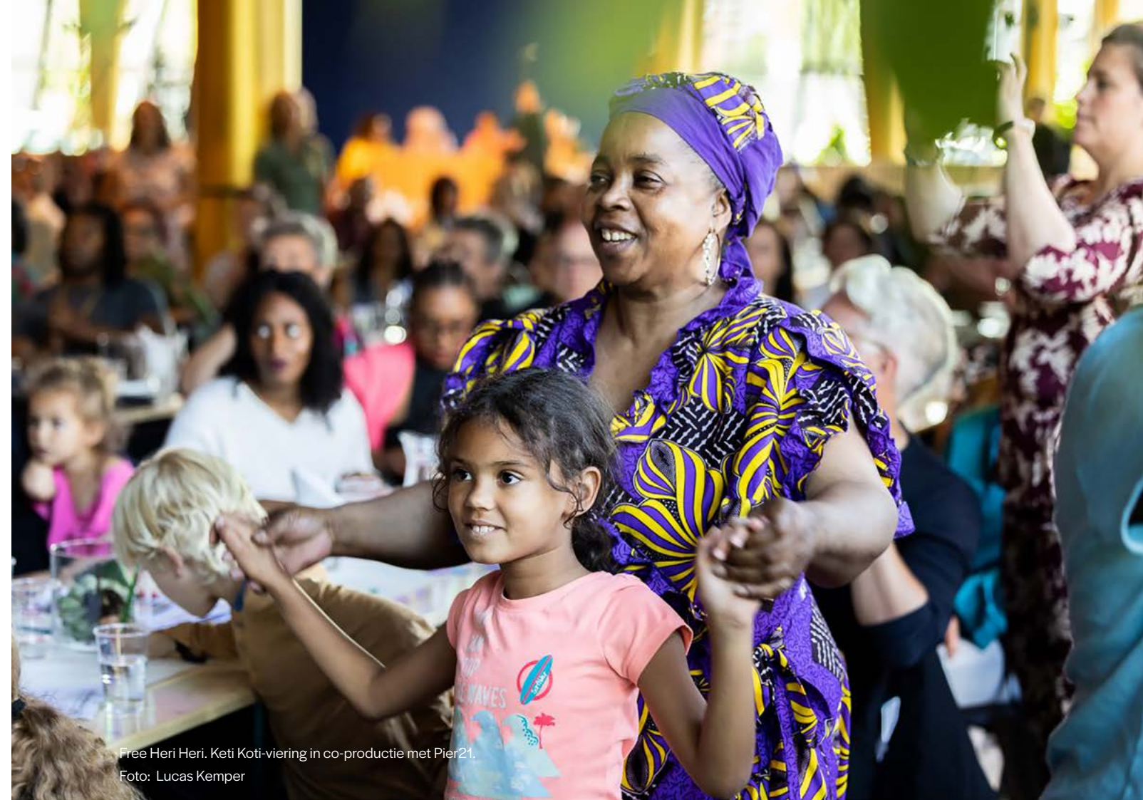
Free Heri Heri. Ketji Koti-viering in co-productie met Pier21.