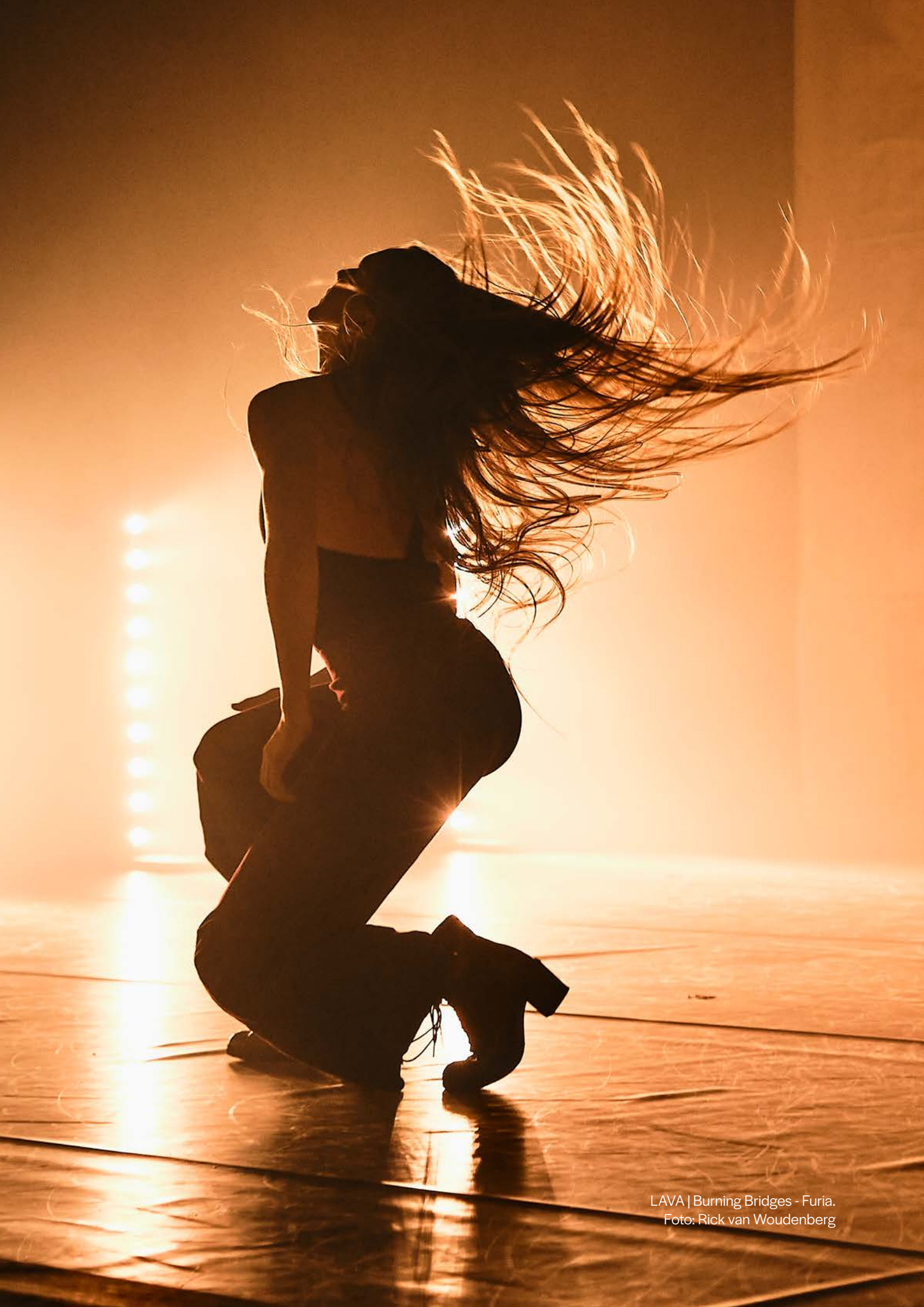
LAVA | Burning Bridges - Furia.