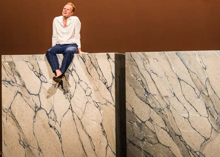
Fabuch Social Cinema - #1 Gemma Co-productie met De Harmonie.

Drie dagen lang werd De Harmonie omgetoverd tot een wereld vol verhalen met dans, theater, muziek en kunst. Een festival dat de fantasie van elk kind prikkelde. Ook voor de jongste kinderen en hun ouders was er een programma: BB van Wonderland Collectief was voor baby's vanaf 6 maanden. Met Hotel Hierwaardaar van De Dansers en Wakkerland van Theater Sonnevancq kwamen ook de oudere kinderen vanaf 8 jaar aan bod. Naast theatervoorstellingen was er een uitgebreid foyerprogramma met onder andere de theatrale installatie De Tussentijdscapsule van de makers van reuzenrad Radman , dat vorig jaar op het Oldehoofsterkerkhof stond. Kunstenaar Machiel Braaksma werkte er samen met kinderen aan een kunstwerk. Middels deze 'festivalisering' lukte het erg goed om niet heel toegankelijk theater dichtbij de bezoekers te brengen en ouders en hun kinderen laagdrempelig kennis te laten maken met voorstellingen als deze. Op deze manier zien zij De Harmonie meer als logische plek om naartoe te gaan.