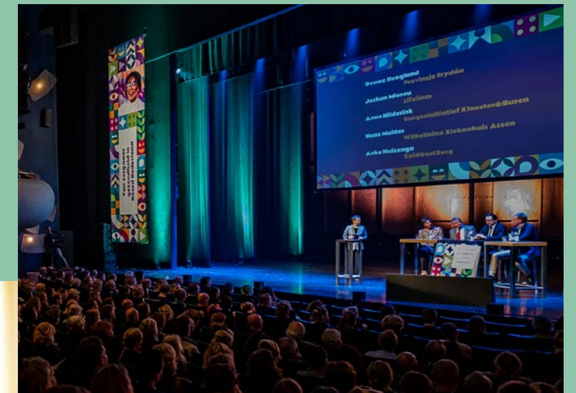
Evenement Het Gezondheidsfestival. >