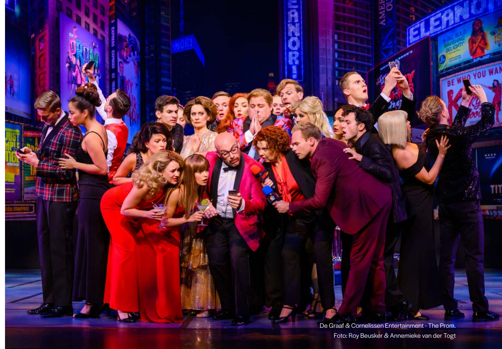
De Graaf & Cornelissen Entertainment - The Prom.

Gezamenlijk is geconstateerd dat Corona geen gemakkelijke periode is geweest voor De Harmonie (dicht, gedeeltelijk open, weer dicht, open etc.). Als organisatie hebben we onze draai weer moeten vinden. De Harmonie heeft zich tot het uiterste ingespannen om zo flexibel mogelijk en wendbaar mee te bewegen met alle ontwikkelingen en vooral te blijven denken in kansen en mogelijkheden. We zijn trots op de behaalde resultaten! Deze lijn hopen we in 2023 voort te kunnen zetten.